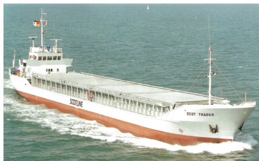
„ Scot Trader “ Foto (1986): Husumer Schiffswerft; GL Tätigkeitsbericht 1986

Volldecker: BRZ/BRT: 1.585/ 499; NRZ/ NRT: 615/ -; Tragfähigkeit: 1.872 t; Abmessungen: L.ü.A.: 82,08 m; L.zw.d.L.: 77,50 m; Br.a.Spt.: 11,30 m; Tfg.: 3,65 m; Seitenhöhe: 5,40/ 3,19 m (Ober- /II. Deck) Rauminhalt: 2.903 m 3 Schüttgut; 2.888,0 m 3 Stückgut Antriebsanlage: 1 MAN – Burmeister & Wain Dieselmotor, Viertakt, 8 Zylinder, einfach- wirkend; Typ 8 L 20/27; 600 kW; 900 U/min; 1 Verstellpropeller; 230 U/min; 10,0 kn. Sondereinrichtungen: 1 Flossenruder, System Hinze; 1 Bugquerstrahlpropeller, 120 kW; 1 Wellengenerator, 140 kVA, , 440/220 V, 60 Hz Kräne: - Ladebäume: - Luken: 1 – 50,40 m x 9,00 m Besatzung: bis 7 Passagiere: - Schwesterschiffe: „Leona“ (Bau-Nr. 1493); „Silvia“ (Bau-Nr. 1495); „Inga“ (Bau-Nr. 1499); „Edith“ (Bau-Nr. 1500);