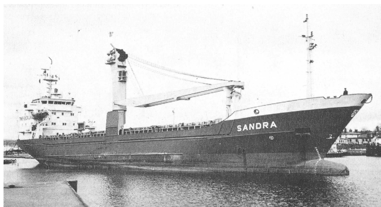
„Sandra“ Foto(04.1984): T. Bolton; Marine News 1985, Nr. 05

Abmessungen: BRZ: 1.491; NRZ: 1.057; Tragfähigkeit: 3.229 t; L.ü.A.: 89,95 m; L.zw.d.L.: 78,60 m; Br.a.Spt.: 14,00 m; Tfg.: 5,58 m; Seitenhöhe: 7,90/ 5,87 m (Ober- /II. Deck) Rauminhalt: 5.093,0 m 3 Schüttgut; 4.938,0 m 3 Stückgut Container: 177 TEU (96 TEU u. Deck; 81 TEU an Deck) Antriebsanlage: 1 Krupp-MaK Dieselmotor, Viertakt, 8 Zylinder, einfachwirkend; Typ 8 M 453 AK; 2.001/ 1.470 kW; -/ 550 U/min; 1 Verstellpropeller ; -/ 180 U/min; 14,3 kn. Sondereinrichtungen: 1 Flossenruder; 1 Bugquerstrahlpropeller, 150 kW; 1 Wellen- generator, 525 kVA; E-Anschlüsse für 15 Kühlcontainer Kräne: 1 – 35,0 t/ 23,5 m bzw. 25,0 t/ 26,0 m Ladebäume: - Luken: 1 – 50,40 m x 10,20 m Besatzung: Passagiere: Schwesterschiffe: -