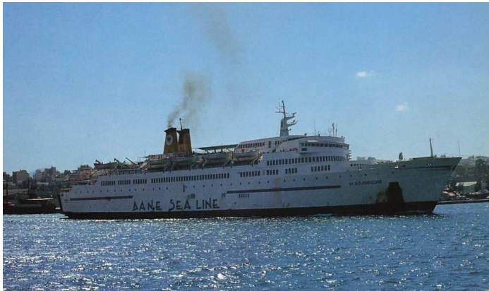
„ Kamiroi “