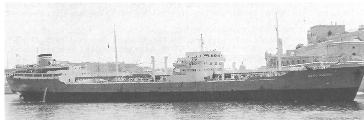
„Capo Madre“ Foto (07.1970); Valletta; M. Cassar; Marine News 1994, Nr. 10

1968 "Capo Gallo" Cia. di Navigazione S.p.A., Messina; Mgr: - ; "Capo Madre"; Messina - Italien