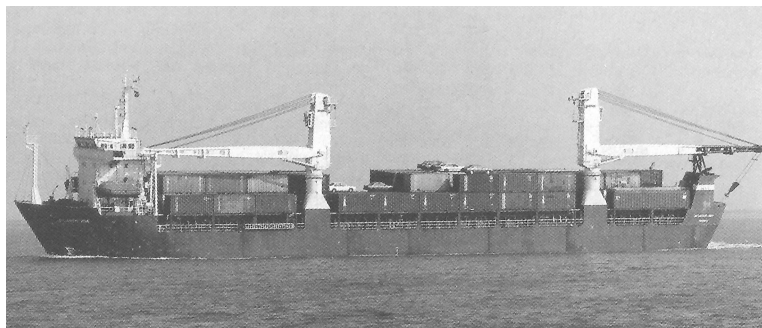
„Atlantic Bay“

1996 Atlantic Horizon Shipping Corp., Nassau; Mgr.: Oost Atlantic Lijn B.V., Rotterdam, Niederlande; „Atlantic Bay“; Nassau - Bahamas