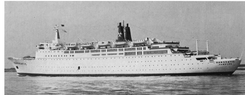
„Hanseatic“ Foto ( ): P. C. Brandwijk; Kludas, A.; Die großen Passagierschiffe, Band V