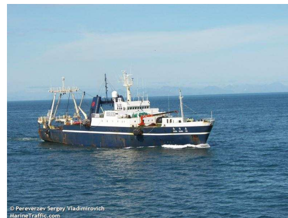
„Joon Sung Ho“

Abmessungen: BRT: 3.183; NRT: 1.368; Tragfähigkeit: 2.314 t L.ü.A.: 92,00 m; L.zw.d.L.: 82,20 m; Br.a.Spt.: 15,00 m; Tfg. (max.): 6,10 m Seitenhöhe: 9,55/ 6,98 (Ober- /II. Deck) Rauminhalt: 1.204,0 m 3 Fischkühlraum; 660,0 m 3 Fischmehl; 80,0 m 3 Tran Container: - Antriebsanlage: 2 MaK Dieselmotoren, Viertakt, 6 Zylinder, einfachwirkend, V-Form; Typ Typ 6 M 551 AK; 3.533 kW; 300 U/min; 1 Verstellpropeller; 170 U/min; 15,5 kn (2.208 kW) Sondereinrichtungen: 2 Wellengeneratoren, je 1.000 kVA; 1 Seitenpforte; Köpf-, Filetier- und Enthäutungsmaschinen; 1 Fischmehlanlage, Kapazität 50,0 t/Tag; 6 Horizontalfroster, Kapazität je 10,0 t/Tag Kräne: - Ladebäume: 2 – 3,0 t Luken: - Tanks: - Besatzung: bis 74 Passagiere: - Schwesterschiffe: „Regulus“ (Bau-Nr. 368); „Mond“ (Bau-Nr. 370)