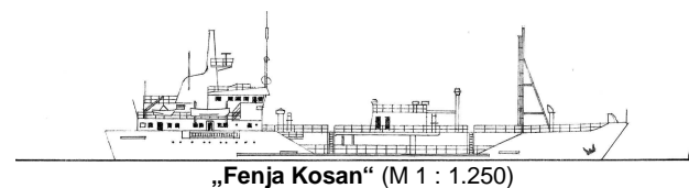
„Fenja Kosan“ (M 1 : 1.250)