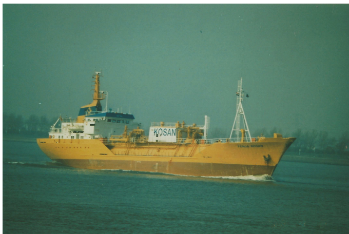
„Fenja Kosan“

1996 Kosan Tankers (Singapore) Pte. Ltd., Singapore; Mgr.: Lauritzen Kosan Tankers A/S, Kopenhagen; „Fenja Kosan“ ; Köge - Dänemark (DIS)