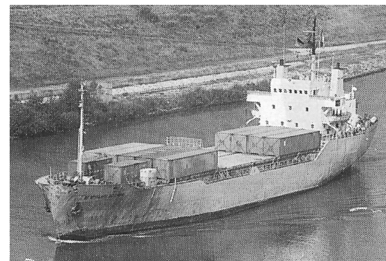
„Starogard Gdanski“ ; Kiel Kanal; THB 10.03.1997

1993 Cava Shipping Co. Ltd., Piräus; Mgr.: Nafto Trade Shipping & Commercial S.A., Piräus, Griechenland; „Cava I“; Piräus - Griechenland