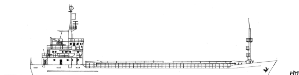
„Alsterberg“ (M 1 : 1.250)

2010 Verkauft zum Abbruch an Hisar GS, Aliaga, Türkei. Ankunft vor Aliaga am 10. September