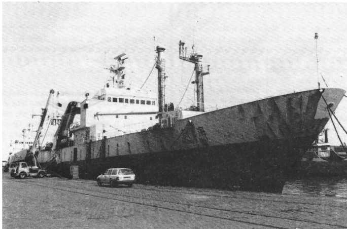
“Geng Hai” Foto ( ); Schiffahrt International 1986, Nr. 07