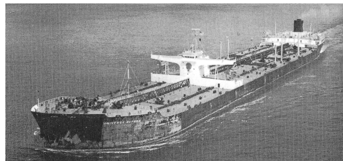
„Universe Daphne“ Foto (v. 1974): F.R. Sherlock; Ocean Ships; 1974

1978 Verkauft zum Abbruch Shyeh Sheng Huat Steel & Iron Works Co. Ltd., Kaohsiung, Taiwan. Ankunft in Kaohsiung vor dem 09. November; Beginn des Abbruchs am 05. Dezember