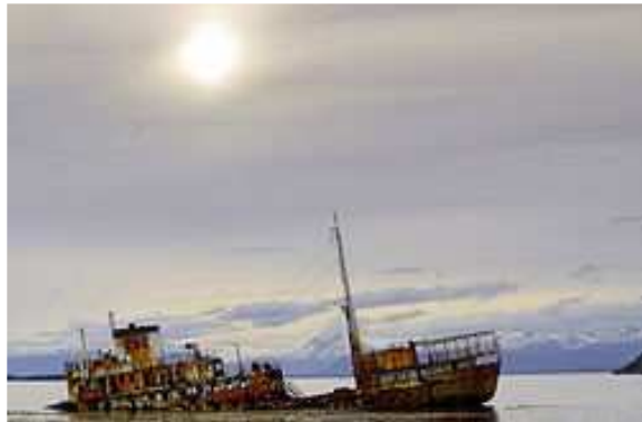
„Logos“ Foto (April 2009); de.wikipedia.org.; 08.05.2015