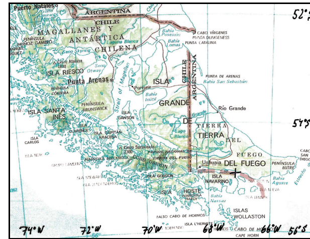
+ = Strandungsstelle