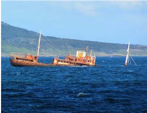
„Logos“ Internet: de-de.facebook.com; 08.05.2015

1988 Am 05. Januar während der Reise Ushuaia, Argentinien – Puerto Madryn, Argentinien, im Beagle Kanal, Feuerland, Argentinien, während schlechten Wetters auf 54°58' S 67°08' W (~ 30 Sm östlich von Ushuai a) kurz nach dem Absetzen des Lotsen durch einen Navigationsfehler auf einen Felsen gelaufen. Der Laderaum Nr. 02 und der Maschinenaum wurden leck geschlagen mit daraus resultierender Bb-Schlagseite von 40°. Passagiere und Besatzung konnten gerettet werden. Als Totalverlust aufgegeben. Danach gelegentlich von der chilenischen Marine für Schießübungen benutzt