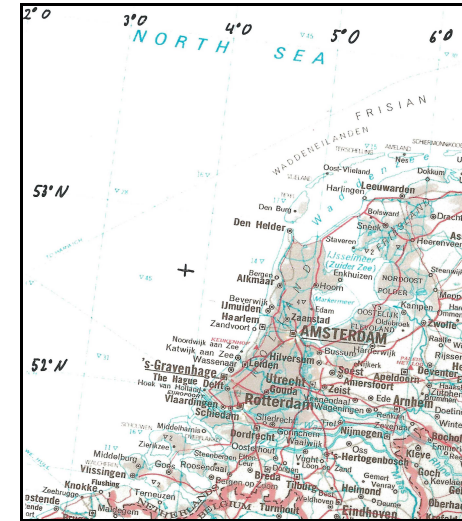
+ = Untergangsstelle

1992 Am 25. Oktober während der Reise Szczecin, Polen – Antwerpen, Belgien, mit einer Ladung Bleikonzentrat In der Nordsee auf 52° 39' N 03° 49.03' O ( ca. 30,0 Sm westnordwestlich von Ijmuiden, Niederlande) nach dem Übergehen der Ladung gekentert und anschließend gesunken. Die 7 Personen umfassende Besatzung wurde von dem Frachter „Sevilla“ (1.414 BRT; Oldenburg-Portugiesische Dampfschiffs-Rhederei Kusen, Heitmann & Cie. KG, Hamburg) aufgenommen.