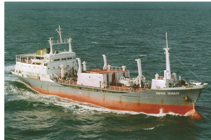
„Sophie Schulte“

Besatzung: 17 Passagiere: - Schwesterschiffe: „Anna Schulte“ (Bau-Nr. 191); „Sophie Schulte“ (Bau-Nr. 193) ~ „Heriot“ (Bau-Nr. 189)