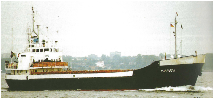
„Mignon“ Foto (1997); H. & L. van Ginderen; Marine News 2005, Nr. 06