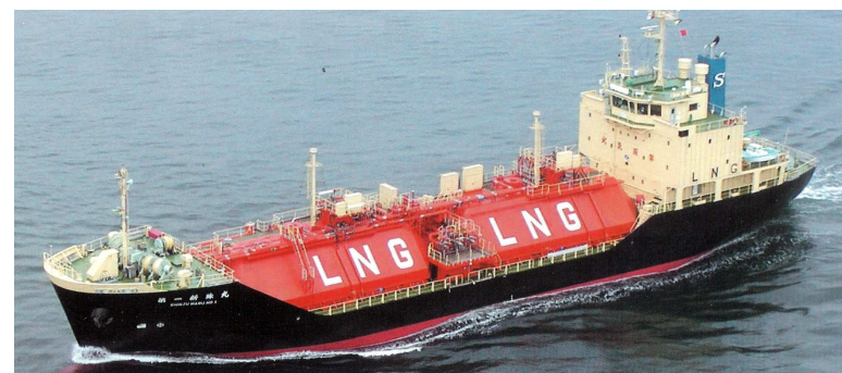
„Shinju Maru No. 1“

Abmessungen: BRT: 2.936; NRT: ; Tragfähigkeit: 1.781 t; L.ü.A.: 86,29 m; L.zw.d.L.: 80,30 m; Br.a.Spt.: 15,10 m; Tiefgang.: 4,18 m; S.-H.: 7,00 m (Oberdeck) Tankinhalt: 2.539,0 m 3 LNG (100 %; - 162°C) Antriebsanlage: 1 Hanshin Dieselmotor, Viertakt, 6 Zylinder, einfachwirkend; Typ 6 LH 36 LA; 1.912 kW; 270 U/min; 1 Vestellpropeller; 270 U/min; 12,7 kn (1.625 kW; 4,18 m Tfg.) Sondereinrichtungen: 1 Bugquerstrahlpropeller, 0,5 t Schub; 1 Hochleistungsrueder, System Schilling Monovec Kräne: - Ladebäume: 2 – 2,0 t Luken: - Tanks: 2 (zylindrische Festtanks, Drucktanks IMO Typ C; Aluminium; L: ~ 22,6 m, Ø ~ 9,10 m; max. Druck 3,0 bar ); Wärmedämmung System Kawasaki Besatzung: 12 + 1 Passagiere: - Schwesterschiffe: „Kakurei Maru“ (Bau-Nr. 615); „Shinju Maru No. 2“ (Bau-Nr. 618); ~ „North Pioneer“ (Shin Kurushima Dockyard Co. Ltd.; Bau-Nr. 5368)