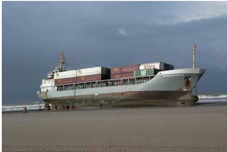
„Heinrich Behrmann“ Foto (10.11.2001, Blankenberge)