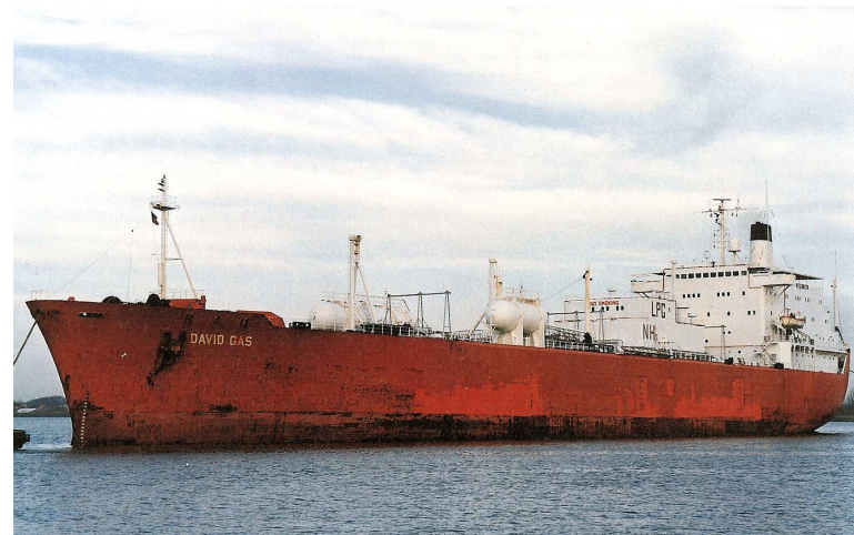
„David Gas“

~ 1991 Marway Shipping Ltd. (50 % Exmar S.A., Antwerpen; 50 % B. Schulte, Hamburg), Monrovia; Mgr.: Dorchester Maritime Ltd.; " David Gas "; Monrovia - Liberia