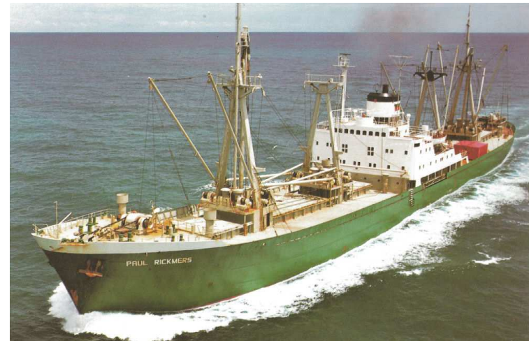
„Paul Rickmers“ Foto (n. 1957); aus Kludas, A.; 150 Jahre Rickmers

1957 Einbau eines zusätzlichen Schwergutladebaumes mit 100,0 t Tragkraft