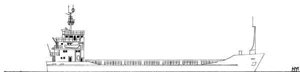
„Nordlicht II“ (M 1 : 1.250)