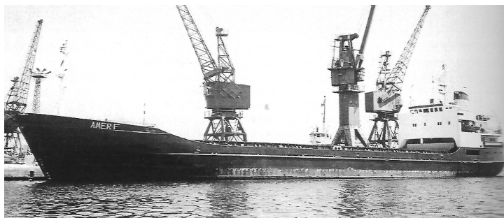
„ Amer – F.“

2004 Nagham Shipping Co., Batumi; Mgr.: Al Fahel Shipping Co.; „ Amer - F “; Batumi - Georgien