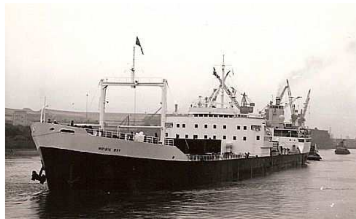
„Moisie Bay“