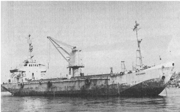
„Sea Sabah“