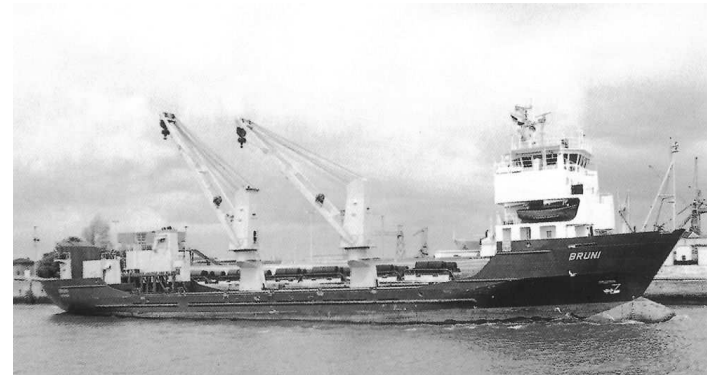
„Bruni“