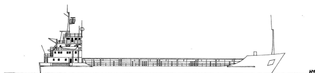
„Manchester Falcon“ (M 1 : 1.250)