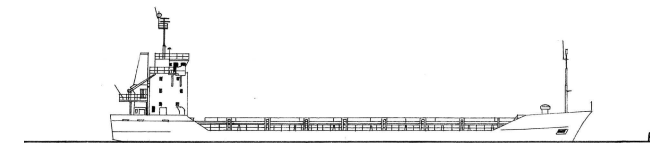
„ Maja-M “ (M 1 : 1.250)