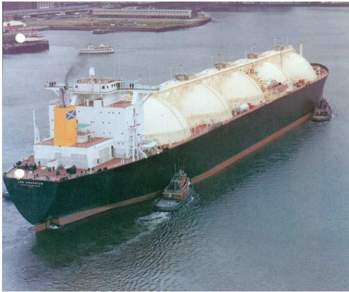
"LNG Aquarius"