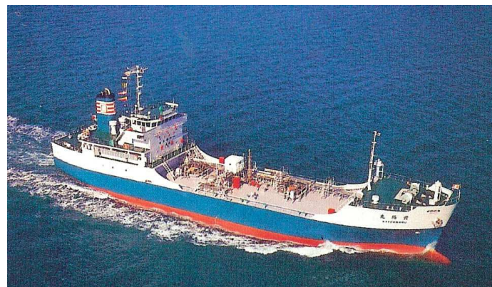
„ Kayo Maru “

1992 Daiichi Marine Co. Ltd., Tokio; Mgr.: - ; „ Kayo Maru “; Tokio - Japan