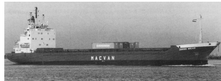
„ Janne Wehr “ (n. Umbau)

1983 Oskar Wehr KG (GmbH & Co.), Hamburg; KR.: - ; „ Janne Wehr “; Hamburg - Bundesrepublik Deutschland