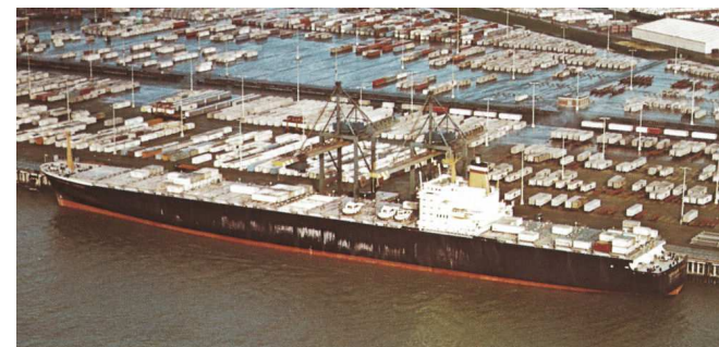
„Hongkong Express“ Foto (~ 1973); Prospekt Bremer Vulkan

Schwesterschiffe: "Bremen Express" (Bau-Nr. 977)