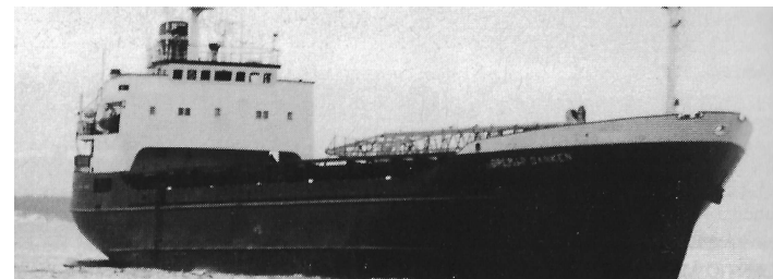
„ Bremer Banken “

1996 Pe – Be Shipping A/S, Scarpborg; Mgr.: Th. Jacobsen & Co. A/S, Scarpborg; „ Bremer Banken “; Scarpborg - Norwegen (NIS)