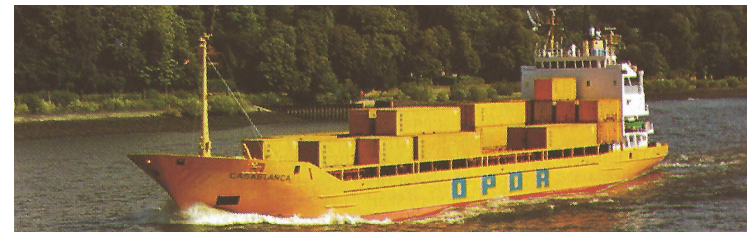
„Casablanca“

1994 Neue Vermessung; danach: BRZ: 2.765; NRZ: 1.409