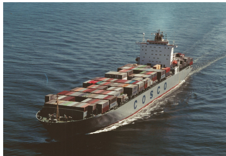
„Fei He“ Foto (04.1994)