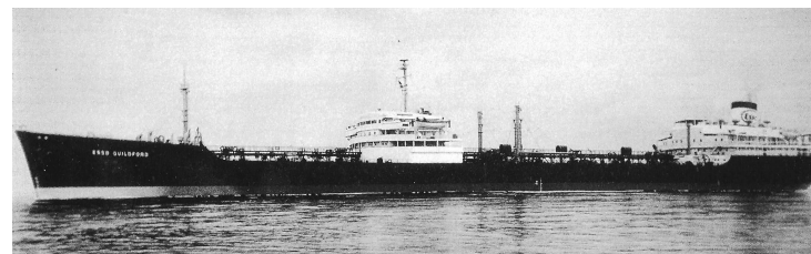
„Esso Guildford“ Foto (1957); R. Thiel; Geschichte der AG „Weser“

„Esso Switzerland“ (Cantieri Riuniti dell Adriatico; Bau-Nr. 1835); „Esso Trinidad“ (Cantieri Riuniti dell Adriatico; Bau-Nr. 1838); „Esso Liverpool“ (Cantieri Riuniti dell Adriatico; Bau-Nr. 1841); „Esso Roma“ (Cantieri Riuniti dell Adriatico; Bau-Nr. 1848); „Esso Dublin“ (Cantieri Riuniti dell Adriatico; Bau-Nr. 1849)