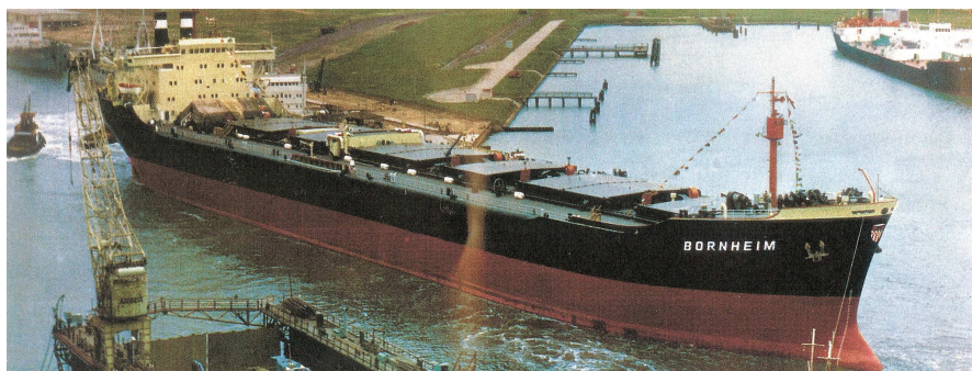
Schwesterschiff „Bornheim“

Abmessungen: BRT: 26.531; NRT: 19.031; Tragfähigkeit: 44.015/ 42.805 t; L.ü.A.: 226,86 m; L.zw.d.L.: 217,20 m; Br.a.Spt.: 27,20 m; Tfg.: 10,74/ 10,53 m; Seitenhöhe: 15,70 m (Oberdeck) Rauminhalt: 56.122,6 m 3 Schüttgut Container: - Antriebsanlage: 1 MAN Dieselmotor, Zweitakt, 7 Zylinder, einfachwirkend; Typ K 6 Z 78/155; 8.243 kW; 118 U/min; 1 Propeller; 118 U/min; 15,0 kn. Sondereinrichtungen: - Kräne: 1 Laufkatze ; 1 Mobilkran an Deck – 4,0 t Ladebäume: - Luken: 2 – 17,60 m x 12,64 m; 1 – 17,00 m x 12,64 m; 1 – 14,40 m x 12,64 m; 1 – 10,50 m x 12,64 m; 3 – 9,60 m x 12,64 m Besatzung: 41 + 2 Reserve Passagiere: - Schwesterschiffe: "Bornheim" (Bau-Nr. 380)