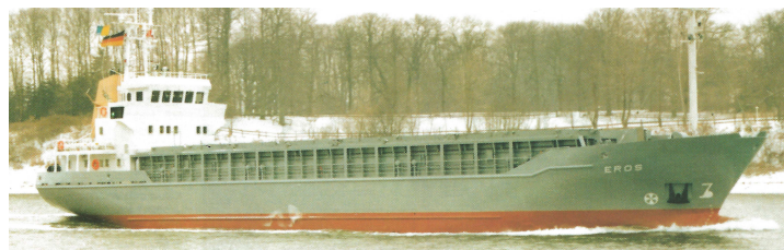
„Eros“ Foto (02.2986; Kiel Kanal); Kröger; GL, Tätigkeitsbericht 1986