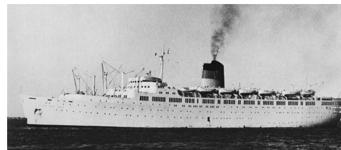
„Queen Anna Maria“

Foto (1956): Canadian Pacific; Kludas, A.; Die großen Passagierschiffe, Band V