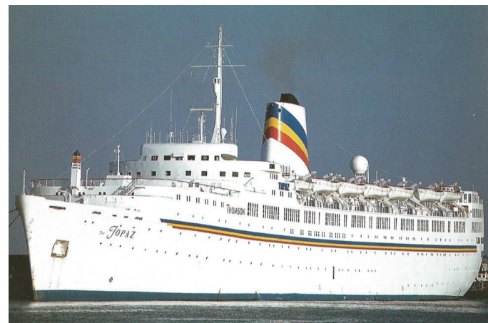
„ The Topaz “