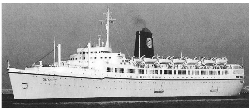
„ Olympic “ Foto (1996): F. van Otterdijk; Kludas, A. die großen Passagierschiffe; 1997