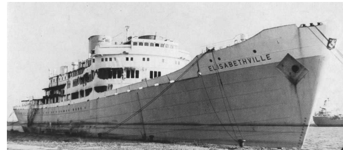
„ Elisabethville “ Foto (1968; Antwerpen): Sammlung A. Kludas; Kludas, A.; Die großen Passagierschiffe, Band

1968 Verkauft zum Abbruch an Van Heyghen Freres, Ghent, Belgien. Nach einem Teilabbruch in Antwerpen am 27. Dezember in Schlepp ab Antwerpen zum endgültigen Abbruch in Ghent, Belgien