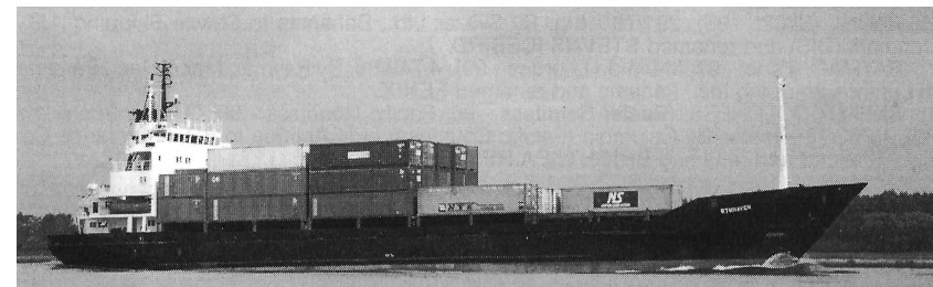
„ Rynhaven “