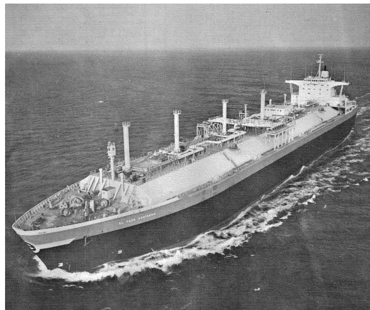
„El Paso Southern“

Abmessungen: BRT: 69.472; NRT: 54.928; Tragfähigkeit: 75.171/ 63.460 t; L.ü.A.: 289,10; L.zw.d.L.: 276,15 m; Br.a.Spt.: 41,15 m; Tiefgang.: 11,91/ 10,97 (Entwurf) m; S.-H.: 29,26/ 25,90/ 20,80 m (Trunk-/ Hauptdeck) Tankinhalt: 126.540,0 m 3 LNG (100 %; - 165°C) Antriebsanlage: 1 Getriebedampfturbine; De Laval Turbine Inc.; Typ AP 35/109; 2 Wasserrohrkessel; 75,9 bar; Dampfleistung je 69,4/ 60,3 t/h (max./ normal); Gas-/Ölfeuerung; Foster- Wheeler; 29.800/ 26.856 kW; 1 Propeller; 105/102 U/min; 18,5 kn (26.856 kW; 10,97 m Tfg.) Sondereinrichtungen: 1 Bugquerstrahlpropeller; 1.120 kW; 1 Heckanker Ladebäume: - Kräne: 1 Laufkran (querschiffs verfahrbar) Luken: - Tanks: 6 (Membrantanks, System Technigaz– Conch Ocean Typ Mark I; max. 0,48 t/m 3 ; max. 0,25 bar; - 165°C; Tankwandung [= 1. Barriere] 9 % Ni-Stahl, kreuzweise gesickt; Abstand der Sicken 340 mm; Dicke 1,2 mm. Wärmedämmung aus Balsaholzpanelen; Dicke 222 mm; dazwischen Sperrholz als 2. Barriere; unter den Panelen zwischen deren 140 mm dicken Auflagern Fiberglas Besatzung: 34 Passagiere: - Schwesterschiffe: „El Paso Arzew“ (Bau-Nr. 609); „El Paso Howard Boyd“ (Bau-Nr. 610)