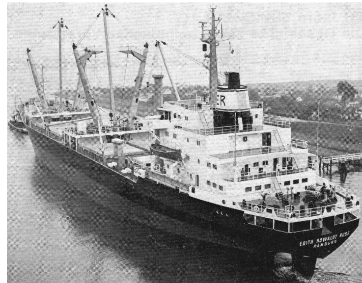
„ Edith Howaldt Russ “ Foto (1972; Travemünde); Orenstein & Koppel AG; Schiff und Hafen 1972, Nr. 06

1980 Seereederei Howaldt KG, Hamburg; KR: E. Russ, Hamburg; „ Edita “; Hamburg - Panama