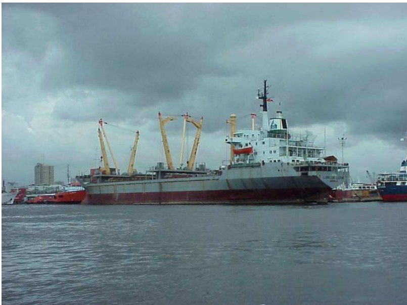
„Lorcon Luzon“

2001 Lorenzo Shipping Co., Manila; Mgr.: - ; „Lorcon Luzon“; Manila - Philippinen