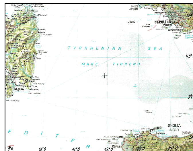
+ = Untergangsstelle