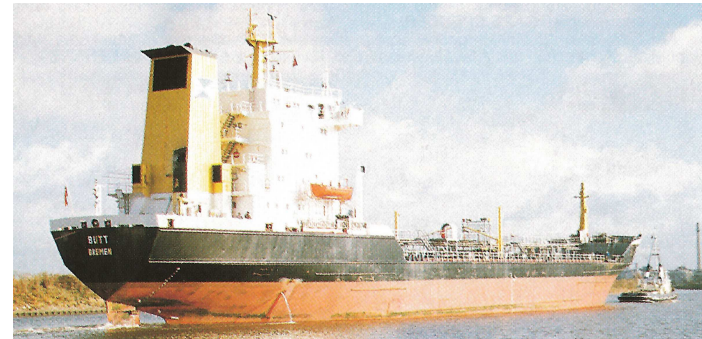
„Butt“ Foto (01.02.2003; Manchester Ship Canal); Marine News 2004, Nr. 11)