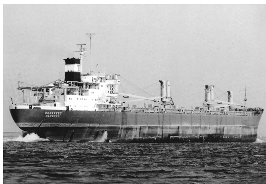
„Budapest“ Foto ( ) : J. Krayenbosch; Deutsche Reedereien, Band 16

Abmessungen: BRT: 24.649; NRT: 18.603; Tragfähigkeit: 43.442 t; L.ü.A.: 203,15 m; L.zw.d.L.: 192,78 m; Br.a.Spt.: 28,50 m; Tfg.: 11,60 m; Seitenhöhe: 15,95 m (Oberdeck) Rauminhalt: 57.619,6 m 3 Schüttgut; 49.723,7 m 3 Stückgut Container: - Antriebsanlage: 1 Bremer Vulkan - MAN Dieselmotor, Zweitakt, 9 Zylinder, einfachwirkend; Typ K 9 Z 70/120 E; 9.274 kW; 140 U/min; 1 Propeller ; 140 U/min; 16,0 kn. Sondereinrichtungen: - Kräne: 3 – 2 x 11,0 t (gekoppelt 22,0 t); 1 – 11,0 t Ladebäume: - Luken: 3 – 18,05 m x 12,90 m; 1 – 12,35 m x 12,90 m; 1 – 11,40 m x 12,90 m; 2 – 8,22 m x 12,90 m Besatzung: 31 Passagiere: - Schwesterschiffe: "Prag" (Bau-Nr. 952)