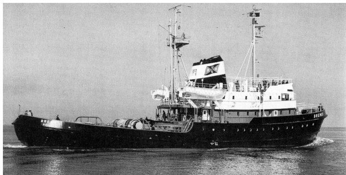
„ Bremen “