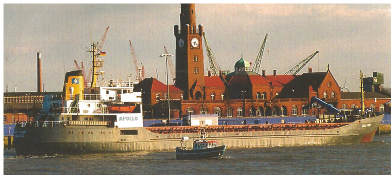
„Anja Funk“ Foto (07.04.2003; Cuxhaven); Strandgut Nr. 66