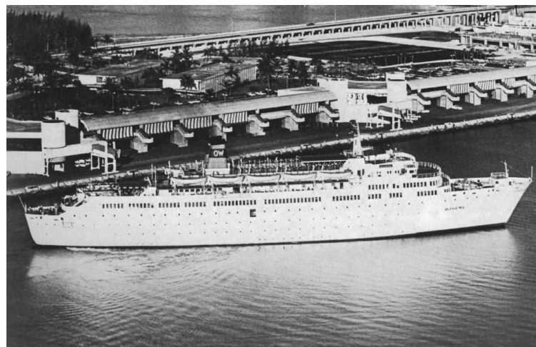
„Boheme“ Foto (v. 1974): J.F.v. Puyvelde; Kludas, A.; Die großen Passagierschiffe...

1970 Umbau durch Blohm & Voss AG, Hamburg; nach dem Umbau: BRT: 10.328; NRT: 5.160; Tfg.: 5,50 m; Pass: 540; Bes.: 170