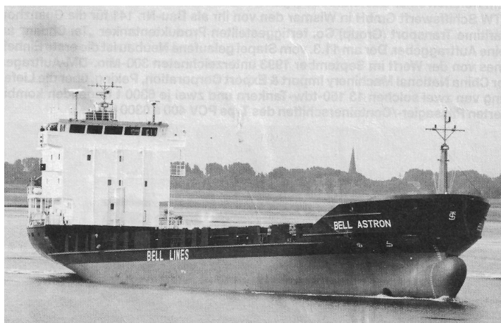
„Bell Astron“ nach der Verlängerung Foto (03.1995, Bremerhaven); THB, 30.06.1995